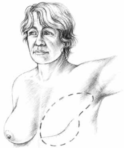
Mastectomi radical addasedig