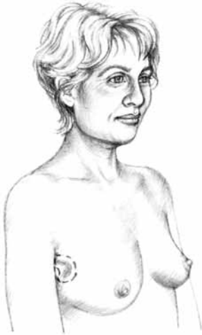
Lwmpectomi neu doriad llydan lleol